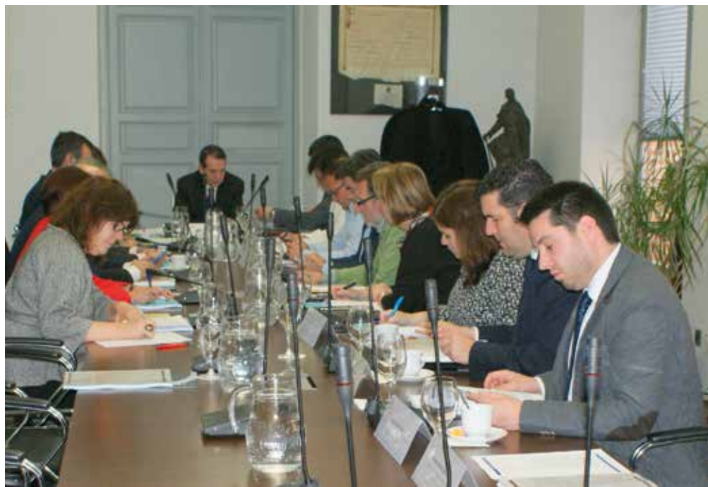
Reunión de la Junta, el pasado 24 de marzo.

Esta convocatoria se hará efectiva si en el proyecto de Presupuestos Generales del Estado para 2017 (cuya presentación aún no se había realizado al cierre de esta edición), no se contempla la reinversión del superávit de las Entidades Locales que la FEMP viene exigiendo desde el comienzo de la Legislatura. A la cumbre serían convocados, todos los miembros de la Junta de Gobierno y del Consejo Territorial de la FEMP, así como los integrantes de las Juntas de Gobierno de las 17 Federaciones Territoria-