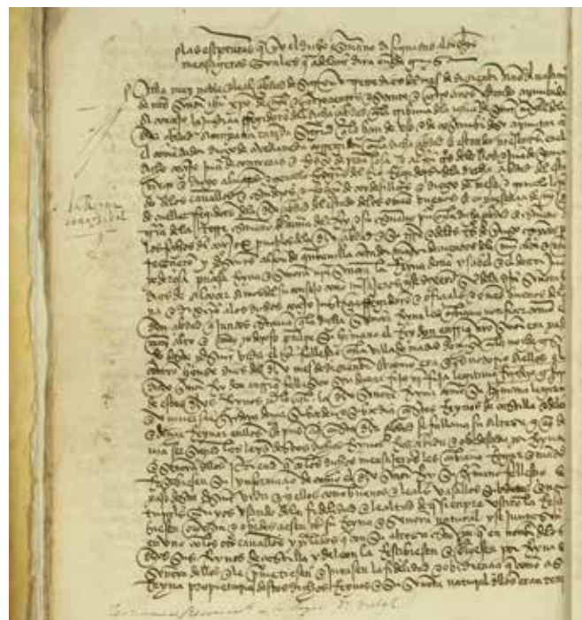
Acta de Proclamación de Isabel de Castilla como Reina (1474).

Por fortuna, el Archivo Municipal de Segovia conserva una gran cantidad de docu-