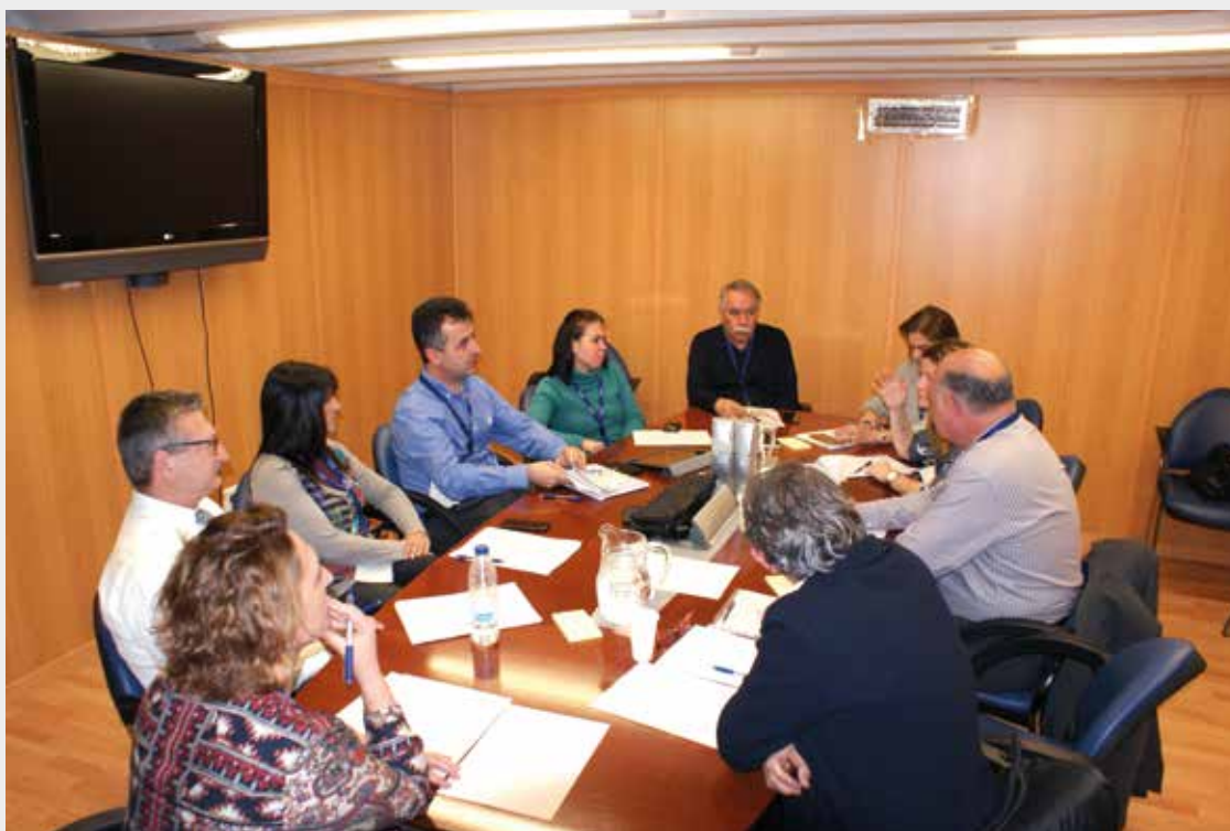
Uno de los Talleres de Trabajo de la Jornada celebrada en la FEMP.