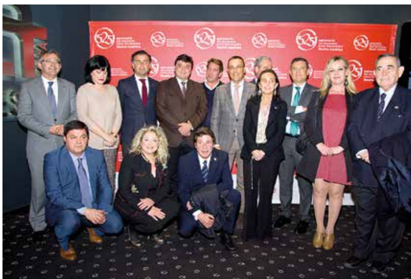
Miembros del Comité Organizador tras la presentación de la programación.

En este sentido, se destaca el Encuentro iberoamericano de Autoridades Locales de la Unión Iberoamericana de Municipalistas que reunirá a unos 100 agentes locales (80 Alcaldes y 20 empresarios) y se celebrará en abril en Huelva, en el Foro de La Rábida, para debatir sobre el papel de los Ayuntamientos en el desarrollo del territorio e intercambiar experiencias en turismo, energías renovables, industrias cárnicas o los sistemas de regadíos.