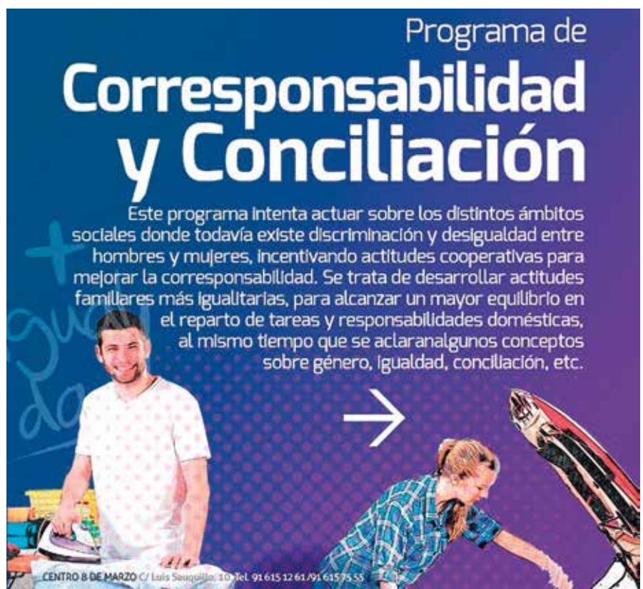
Imagen de uno de los programas que lleva a cabo el Ayuntamiento de Fuenlabrada.

A la convocatoria de este año se han presentado un total de 163 Entidades Locales, de las cuales 153 son Ayuntamientos, 3 Diputaciones Provinciales, 5 Mancomunidades de municipios y 2 Organismos Autónomos.