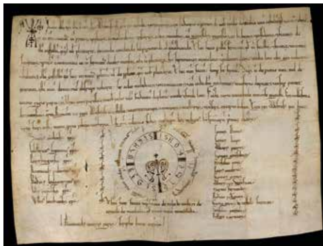
Privilegio rodado por el que Alfonso VIII dona el castillo de Olmos al Concejo de Segovia

Tras los oscuros siglos del primer medievo, Segovia toma su actual configuración a partir de 1088, fecha aceptada como el comienzo de la repoblación de estas tierras por el Conde Raimundo de Borgoña. Es a partir de entonces cuando comenzarán a surgir, dentro y fuera de las murallas, el Alcázar, las casas