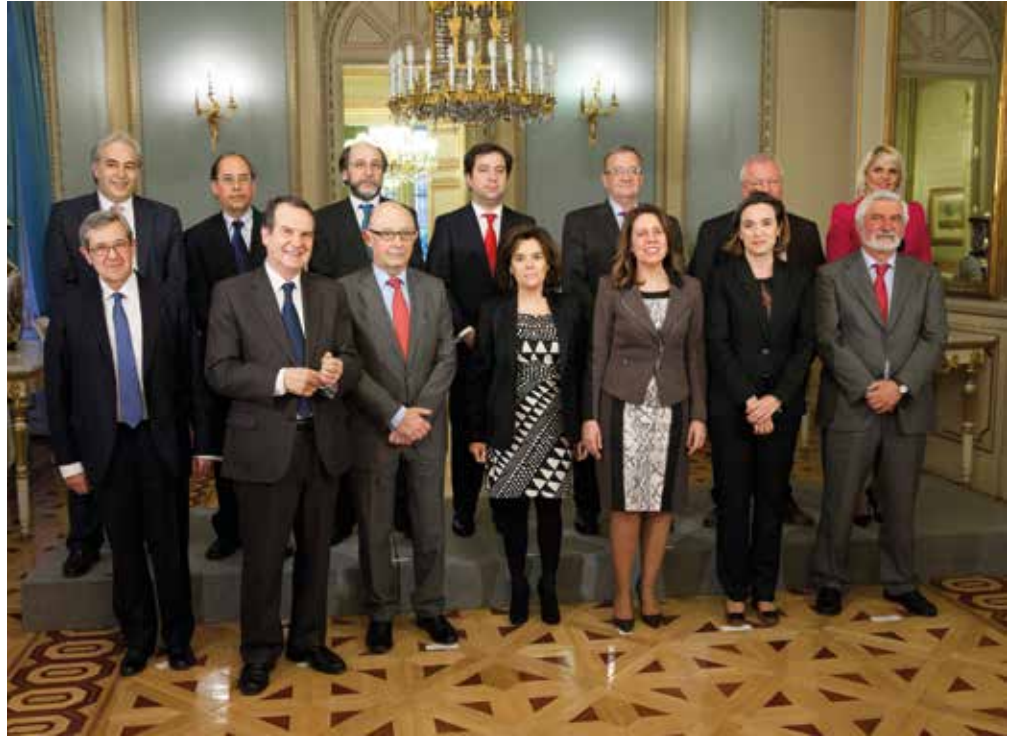
La Comisión de Expertos para el nuevo modelo de Financiación Local, en la Secretaría de Estado para las Administraciones Territoriales.