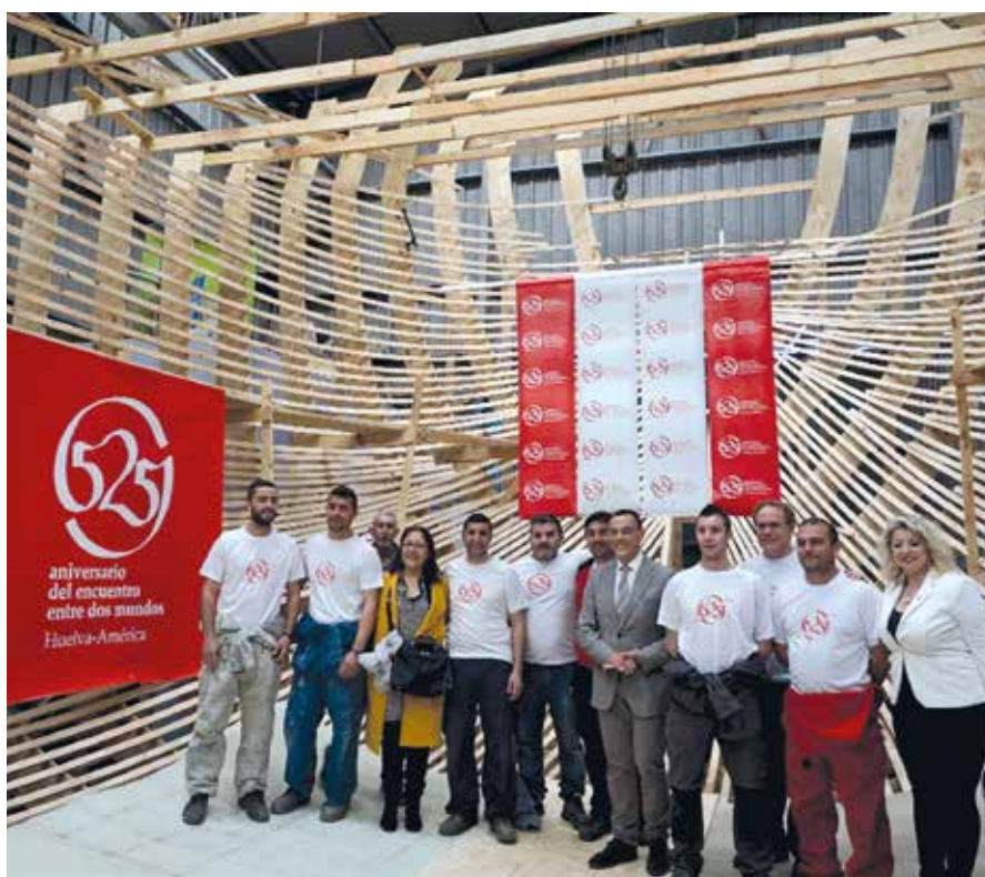
Aproximadamente 100 personas trabajan en la construcción de la réplica de la Nao Santa María.

En su opinión, “bajo este supuesto, 2017 debe ser concebido no como mera ce-