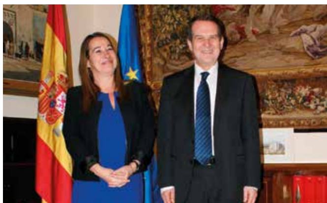
La Secretaria de Estado y el Presidente de la FEMP, en los minutos previos a la reunión.

Con relación a esto último, la FEMP ha planteado a la Secretaria de Estado de Función Pública la dotación de recursos económicos para la implantación total y rápida de la eAdministración. Una inversión que se dividiría en la implantación, con especial atención a medianos y pequeños municipios; el mantenimiento del sistema y los medios necesarios para asesoramiento de quienes se encarguen de la gestión de la herramienta eAdministración.