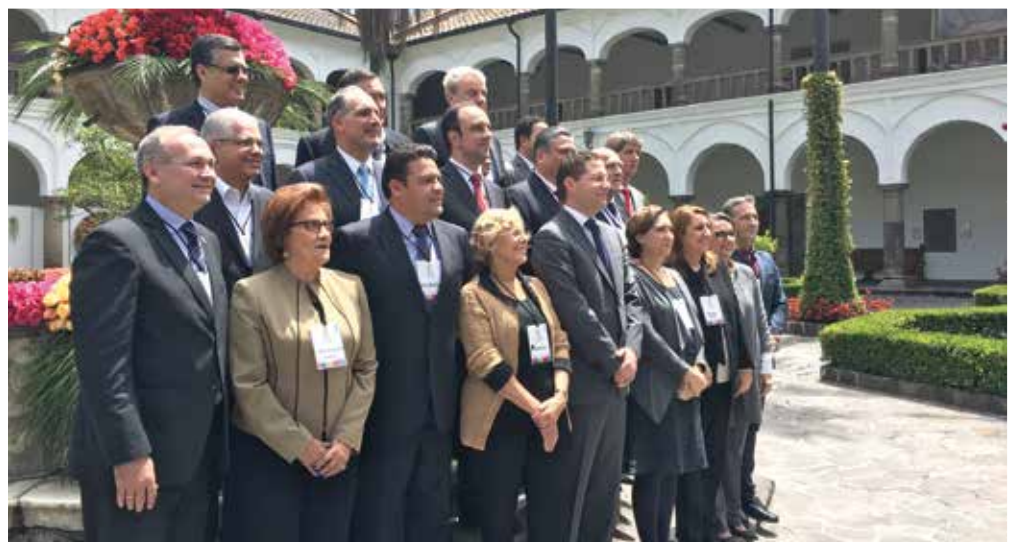
La FEMP se comprometió a acoger la conferencia durante el XI Foro Iberoamericano de Gobiernos Locales, celebrado en Quito (en la imagen).

La Conferencia se desarrollará en la tarde del día 18 de abril. A partir de las 15.30, y tras un acto de bienvenida institucional, representantes de las entidades participantes expondrán sus puntos de vista sobre el papel de los Gobiernos Locales en la gobernanza multinivel de la agenda 2030 para, a continuación, abrir mesas de debate.