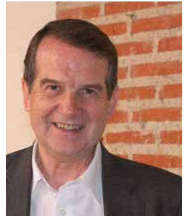
Abel Caballero Álvarez Presidente de la FEMP

Son esos puntos de inflexión los que construyen nuestra historia. Y algunos están ahí, en las siguientes páginas. Bienvenidos a la lectura del número 300.